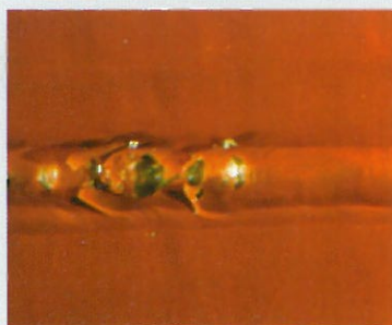
Laminado fibra de vidrio