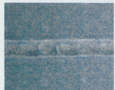
TACMASTER BLUE impregnación especial anti-abrasión.